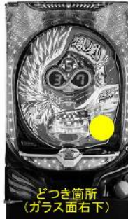
マルホン [Pゴールデン鳳凰∞～全突アクセルスベック～]

エラー音 : あり 液晶 : 振動を検出しました 枠ランプ : 赤点灯 盤面 : 消灯 遊技続行 : 可能 解除方法 : 約60秒後に自動解除