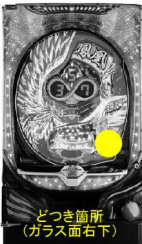
マルホン [Pゴールデン鳳凰∞～全突アクセルスペック～]

【目的】 転生クルーンチャレンジ時にどつき転落を回避させ、∞ゲームへの引き戻しを図る